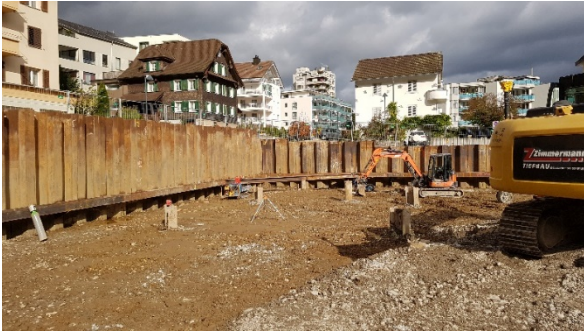
Spundwände als Baugrubenabschlüsse