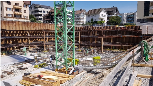
Start mit den Arbeiten an der Bodenplatte