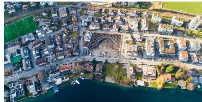
Drohnenfoto mit Blick auf die Baugrube