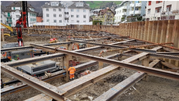
Blick auf die komplexe Anordnung der Spriesskränze