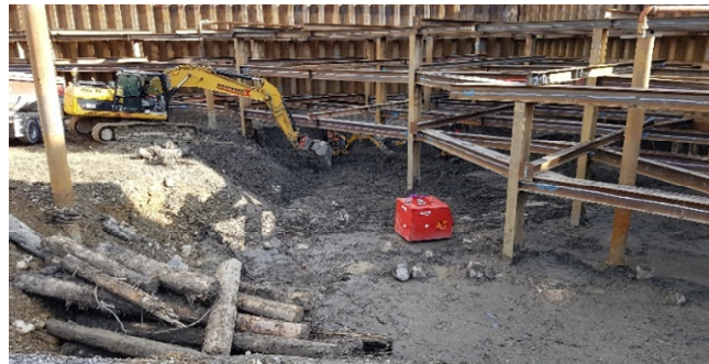
Aushubarbeiten im Bereich der Spriesskränze