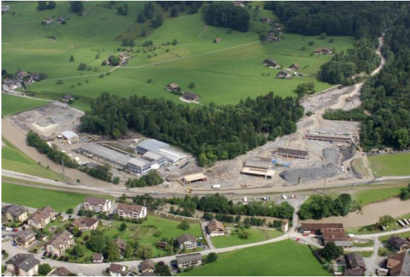
Schadensausmass vom Hochwasserereignis im Jahr 2005